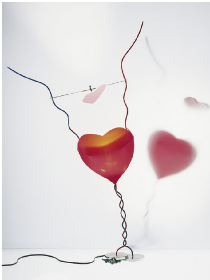
One From The Heart INGO MAURER 1989

Metall, beweglicher Glas-Spiegel, Kunststoff.